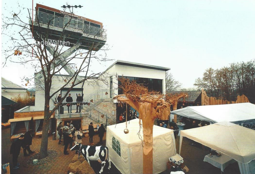
In zwölf Metern Höhe thront die neuartige Gondelsauna über dem neuen Ischgl-Saunadorf.