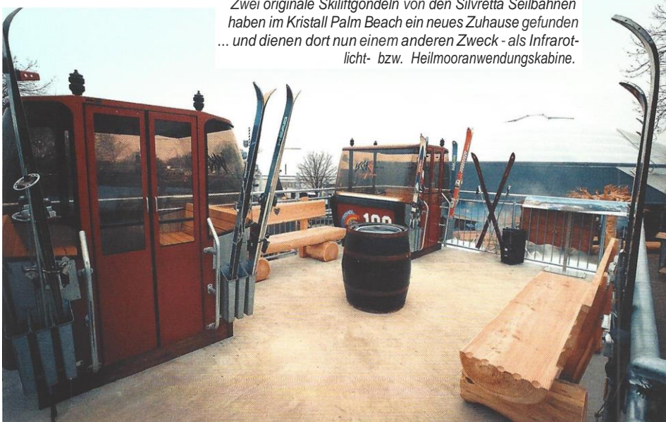
Zwei originale Skiliftgondeln von den Silvretta Seilbahnen haben im Kristall Palm Beach ein neues Zuhause gefunden ... und dienen dort nun einem anderen Zweck - als Infrarotlicht- bzw. Heilmooranwendungskabine.

Als weiterer Eyecatcher wurden zwei original Ischgl-Skiliftgondeln nach Stein gebracht, die die Gäste des bekannten Wintersportorts einst vom Zentrum in die Wintersportarena transportierten. In Stein sind sie nun beheizt und werden dort für Infrarotlicht- und Heilmooranwendungen genutzt. Rund zwei Mio. Euro hat Ge-